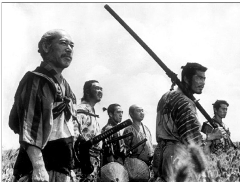
Zdroj: www.altmovieviewpapers.net - z filmu Sedem samurajov

Na tému samurajského meča sa snažila naviazať aj ďalšia americká veľkofilmová produkcia, ktorá však okrem drastických strihov poukázala iba na myšlienku vzdania sa samurajských princípov života ako na stratu vlastnej